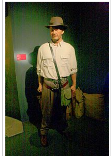
Wassen beeld van Harrison Ford in Musée Grévin.